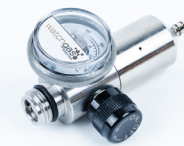
Fixed flow Regulator stainless Steel 715 0.5LPM PN: A0299024 Fixed flow Regulator 715 0.5LPM (Brass) PN: A0195339