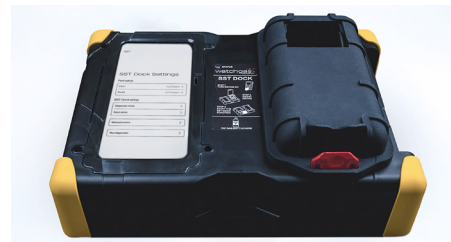
WatchGas SST Docking Station for SST1/SST4/SST4 Pumped Touch screen PN: SST-Dock