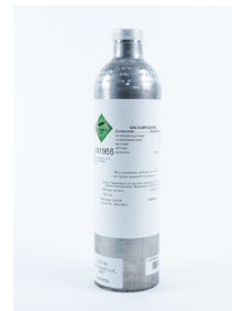
Gasflasche Fragen Sie nach der Verfügbarkeit