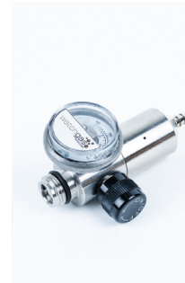
Fixed flow Regulator stainless Steel 715 0.5LPM PN: A0299024 Fixed flow Regulator 715 0.5LPM (Brass) PN: A0195339