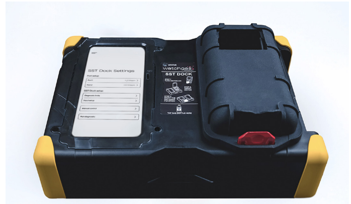
WatchGas SST Docking Station for SST1/SST4/SST4 Pumped Touch screen PN: SST-Dock