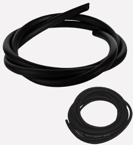
Last-O-More Gas Probenahme-Schlauch