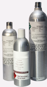
Kalibriergasflaschen für CO 2 in verschiedenen Größen