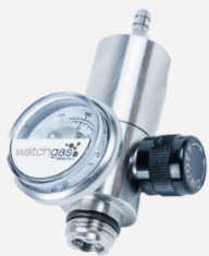
Fixed Flow Regulator 0,5L pro Minute oder 1L pro Minute Edelstahl- Regler