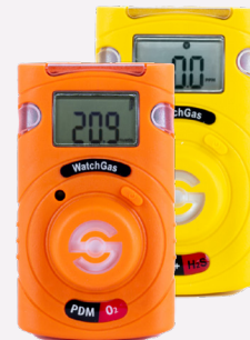
Sehen Sie sich auch den Rest unserer PDM-Familie auf der WatchGas-Website an!

PDM PRO CO 2 wird mit folgendem Liefer- umfang geliefert: