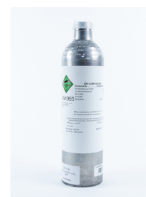
Gasflasche Fragen Sie nach der Verfügbarkeit