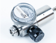
Fixed flow Regulator stainless Steel 715 0.5LPM PN: A0299024 Fixed flow Regulator 715 0.5LPM (Brass) PN: A0195339