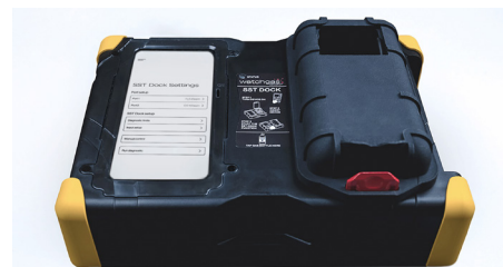
WatchGas SST Docking Station for SST1/SST4/SST4 Pumped Touch screen PN: SST-Dock