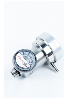
Regulador de Demanda de Flujo