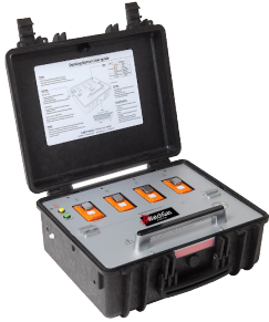
PDM Family Multi Docking Station