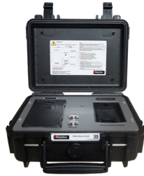
PDM Family Mono Docking Station